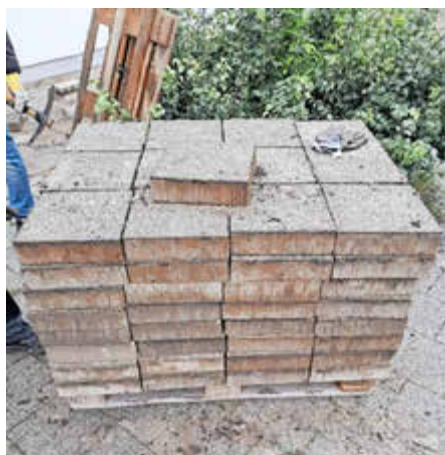
Ausgebaut, gereinigt und sauber gestapelt – so wartet nun das Material auf seine Wiederverwendung beim Bau des Königsbrunner Forums.

Auf der Fläche der ehemaligen Königs-therme entsteht in den nächsten Jahren – unter Wiederverwendung der baulich weiter nutzbaren Gebäude-reste – das Forum Königsbrunn, der neue kulturelle Treffpunkt der Stadt. So wird in den ehemaligen Umkleiden, der ehemaligen Gastronomie und dem ehemaligen Saunabereich die neue Heimat der städtischen Museen, der Bücherei, der Sing- und Musikschule, des Stadtarchivs, eines Cafés sowie einer Rotkreuz-Station werden. Im Bereich der ehemaligen Schwimmhalle, die aus statischen Gründen abgebrochen werden musste, werden der zentrale Zugangsbereich und ein Veranstaltungssaal gebaut, der sowohl durch die Stadt Königsbrunn belegt