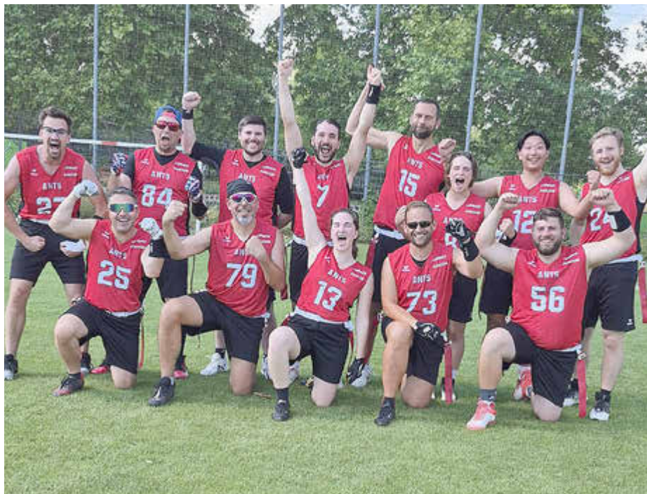
Die Flag Seniors nach vier Siegen in Ingolstadt

Halbfinale, Relegation, Landesleistungsstützpunkt u.v.m.