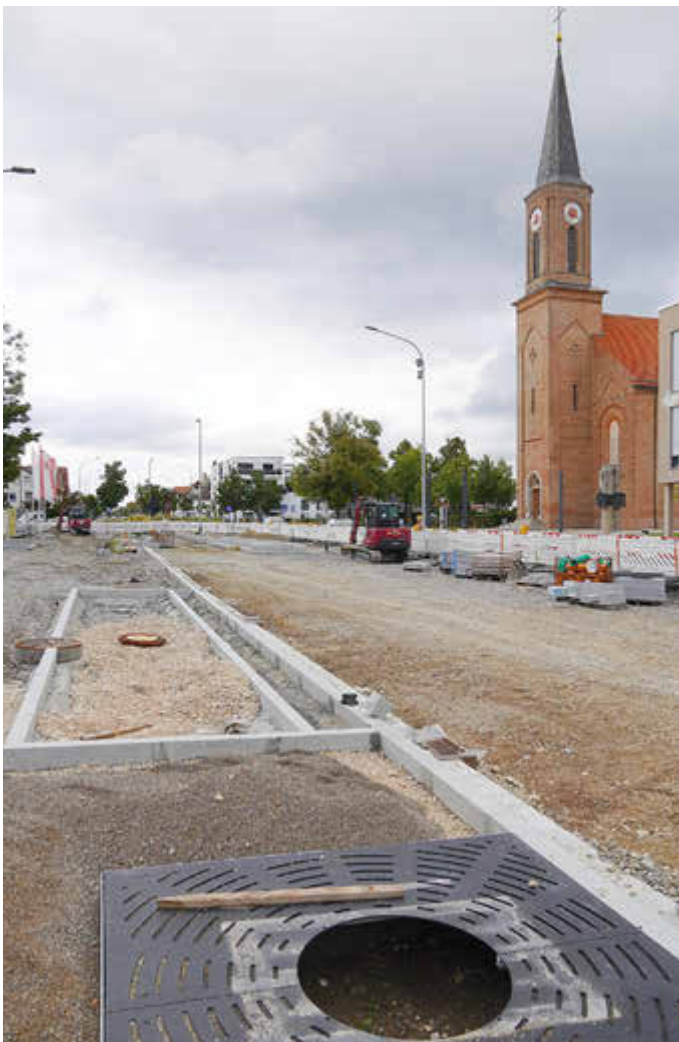
Der Abschluss der Bauarbeiten im nördlichen Bauabschnitt ist für Ende des Jahres 2025 geplant.

Alle Geschäfte, die Gastronomie und Firmen sind weiterhin erreichbar. Nehmen Sie bitte im Baustellenbereich verstärkt Rücksicht auf die anderen Verkehrsteilnehmer!