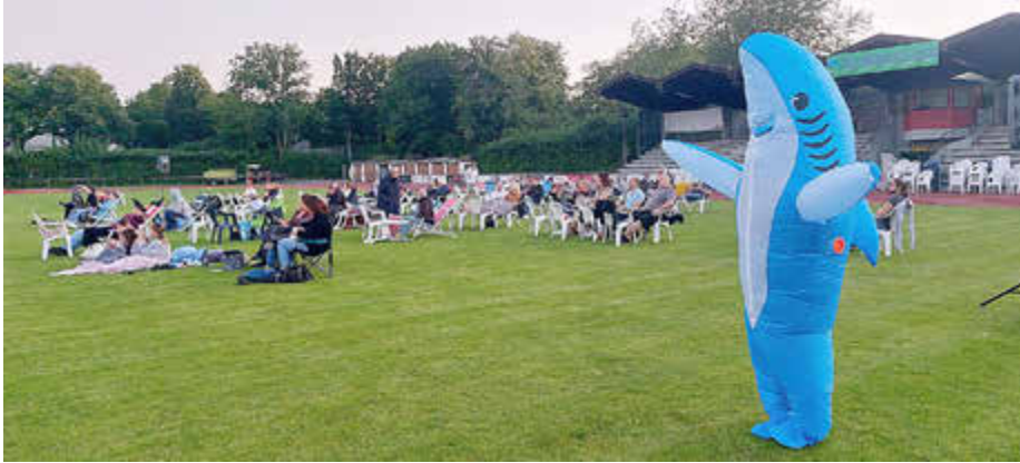
Königsbrunner Kinosommer 2025: Maritimer Besuch bei „Der Weiße Hai“ am 7. August

tolle Events des Königsbrunner Kulturbüros!