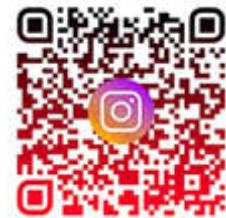
Instagram-Link der Königsbrunn Ants

(American Football Club Königsbrunn Ants)