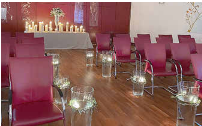
Romantische Atmosphäre im Großen Sitzungssaal

Weitere Informationen finden Sie auf unserer Website.