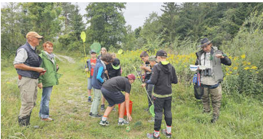
„Natur erleben an Fluss und See“ beim Ferienprogramm am 28. August