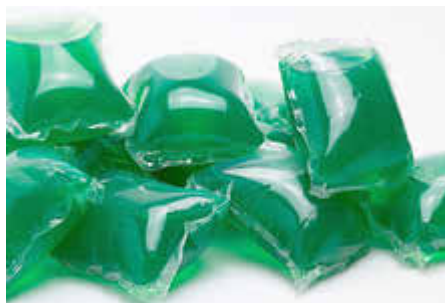
Spültabs mit wasserlöslicher Folie aus Polyvinylalkohol

Was passiert im Klärwerk? Die Stadtwerke geben Auskunft.