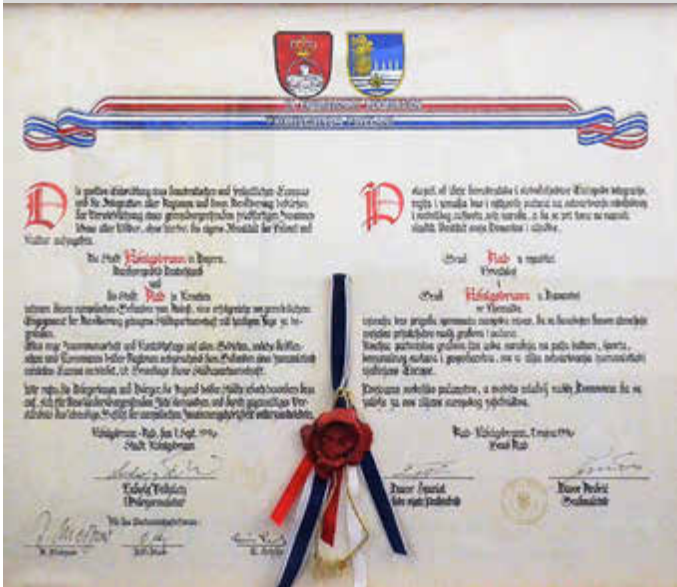
Im Jahr 2026 jährt sich die Unterzeichnung der Partnerschafts-urkunde zwischen den Städten Königsbrunn und Rab zum 30. Mal.

Im Jahr 2013 erschien ein Buch des amerikanischen Politikwissenschaftlers Benjamin Barber mit dem Titel „If mayors ruled the world“, zu Deutsch „Wenn Bürgermeister die Welt regierten“. Darin vertritt Barber die viel beachtete These, dass es gerade die Städte seien, die passende Antworten auf die drängendsten Fragen unserer Zeit bereithielten. Während Staaten zunehmend nationalen Eigeninteressen verfielen, würden die Städte immer mehr zu konstruktiven und kreativen Orten mit Lösungsansätzen auf weltweite Herausforderungen.