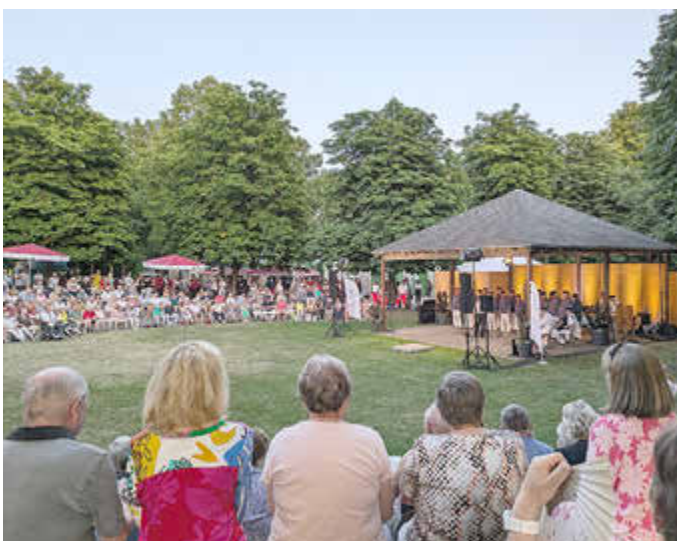
Serenadenabend am 25. Juni