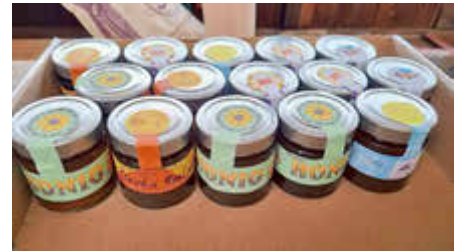
Selbstgestaltete Etiketten des Schulhonigs