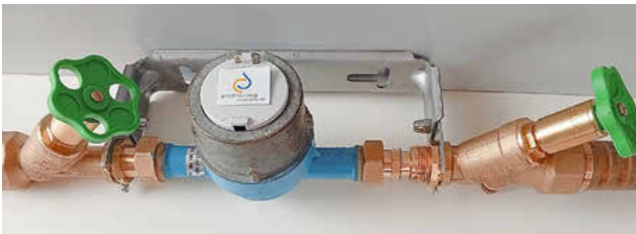
Neue Anlage mit Wasserzählerbügel