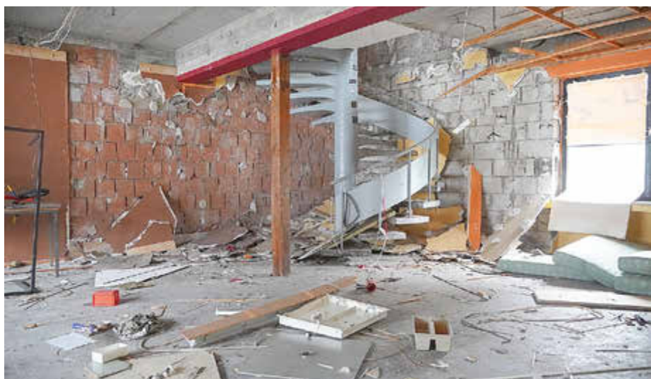
Der Alte Pfarrhof in der Bürgermeister-Wohlfarth-Straße, gegenüber von St. Ulrich, wurde ebenfalls auf wiederverwendbares Baumaterial hin untersucht.