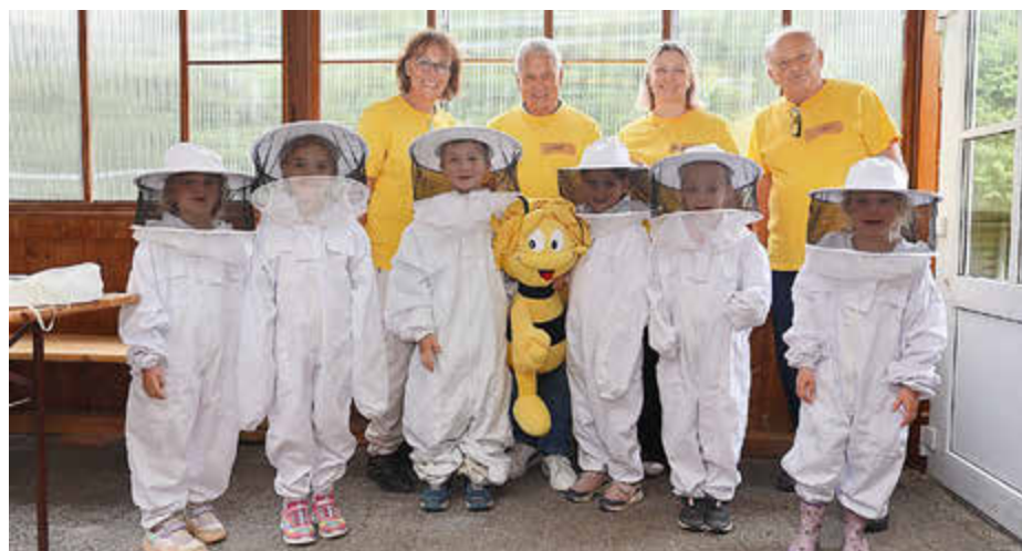
Auf geht's zu den Bienen!