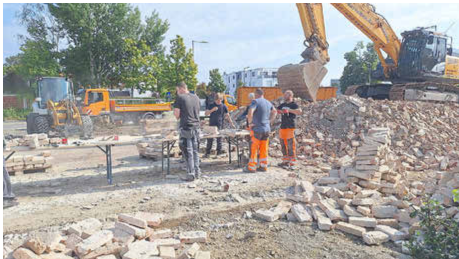
Mitarbeiter der Königsbrunner Stadtverwaltung am Alten Pfarrhof in Aktion!

Forum Königsbrunn – ein Musterbeispiel für Bestandsumnutzung und Materialwiederverwertung