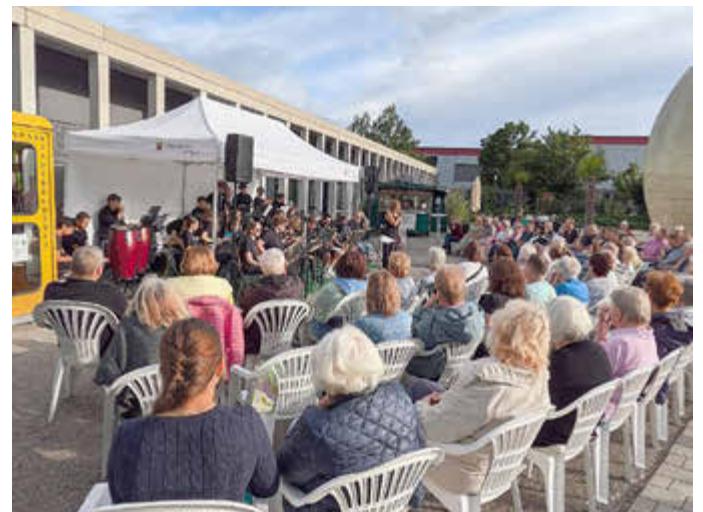
Leseparkkonzert mit der BigBand des Gymnasiums Königsbrunn am 21. Juli