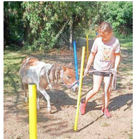
„Ponytime“ beim Ferienprogramm am 19. August