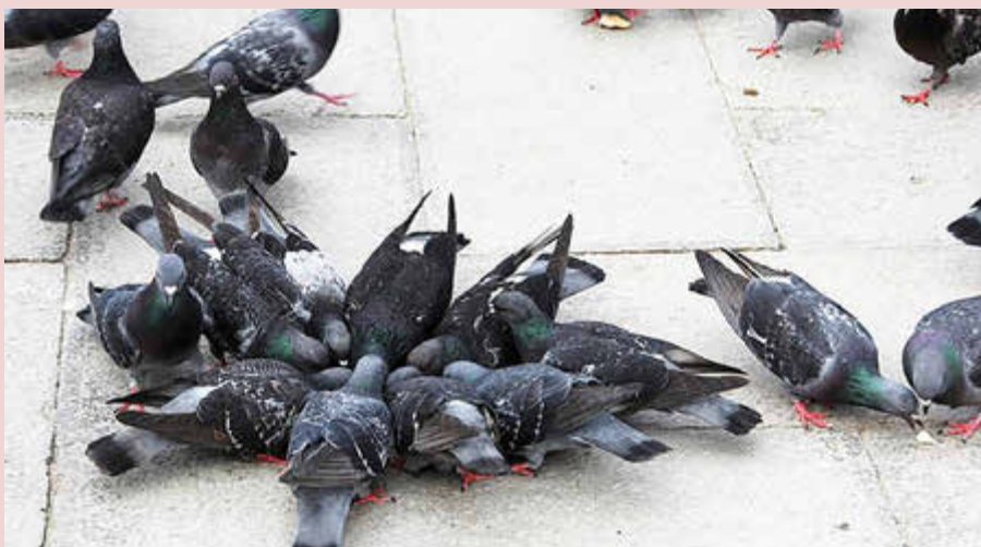
Tauben füttern – in Königsbrunn verboten!