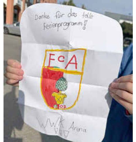
„Besichtigung der WWK-Arena“ beim Ferienprogramm am 6. August