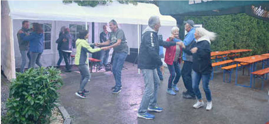
Tanz bis in die Nacht