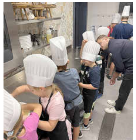
„Spätzle & Cocktails – Kochkurs“ beim Ferienprogramm am 6. August