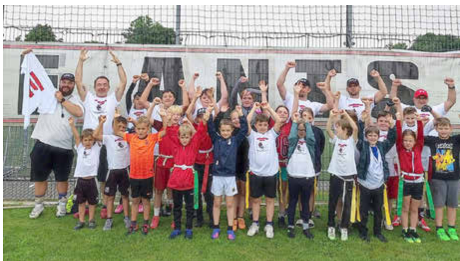
Kids und Coaches am Ende des Summercamps 2025