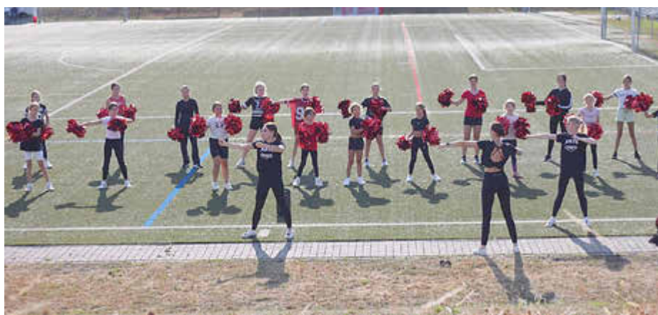
Ants Cheers Juniors