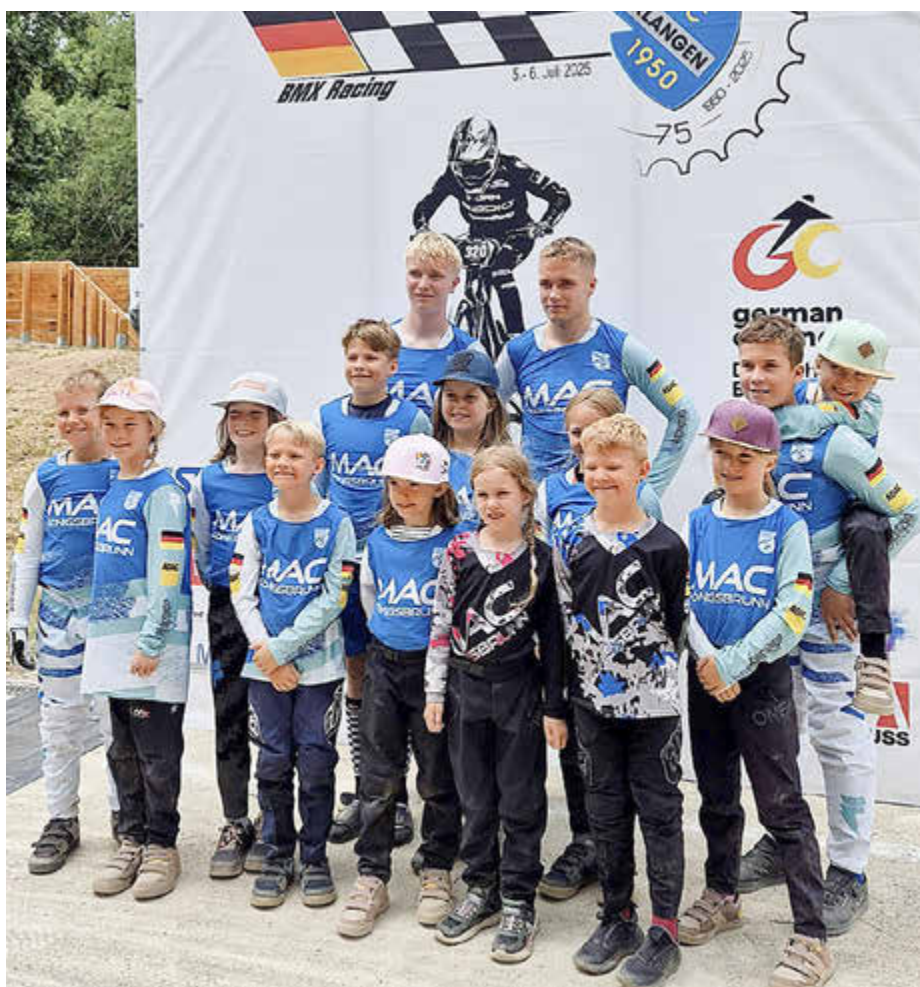
Unsere erfolgreichen BMX-Sportler 10/2025

(MAC Motorrad- und Autosportclub, Holger Stolz)