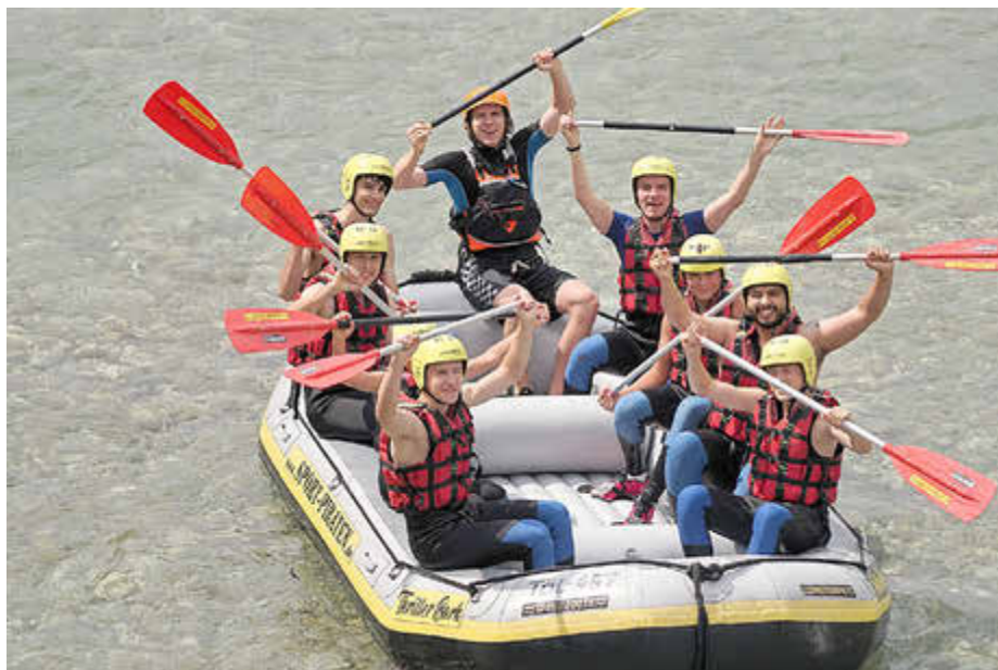
Polizei SV Königsbrunn Tischtennis: Jugendausflug 2025

Konzentrationsstraining fürs Tischtennis mal anders