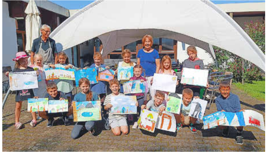
Ferienmal-Aktion in der AWO-Begegnungsstätte

Mit Wasserfarben und Pinsel legten die Schulkinder begeistert los: Da entstanden farbenfrohe Natur-Impressionen mit Bäumen, Blumen und allerlei Getier. Teilweise malten die jungen Künstler gleich mehrere Bilder. Abschließend wurden dann sämtliche Werke noch gemeinsam betrachtet und besprochen. (Königsbrunner Künstlerkreis)