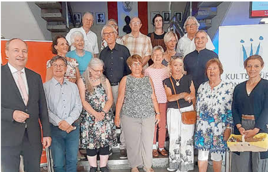
Kulturelle Gautscheröffnung am 23. Juni