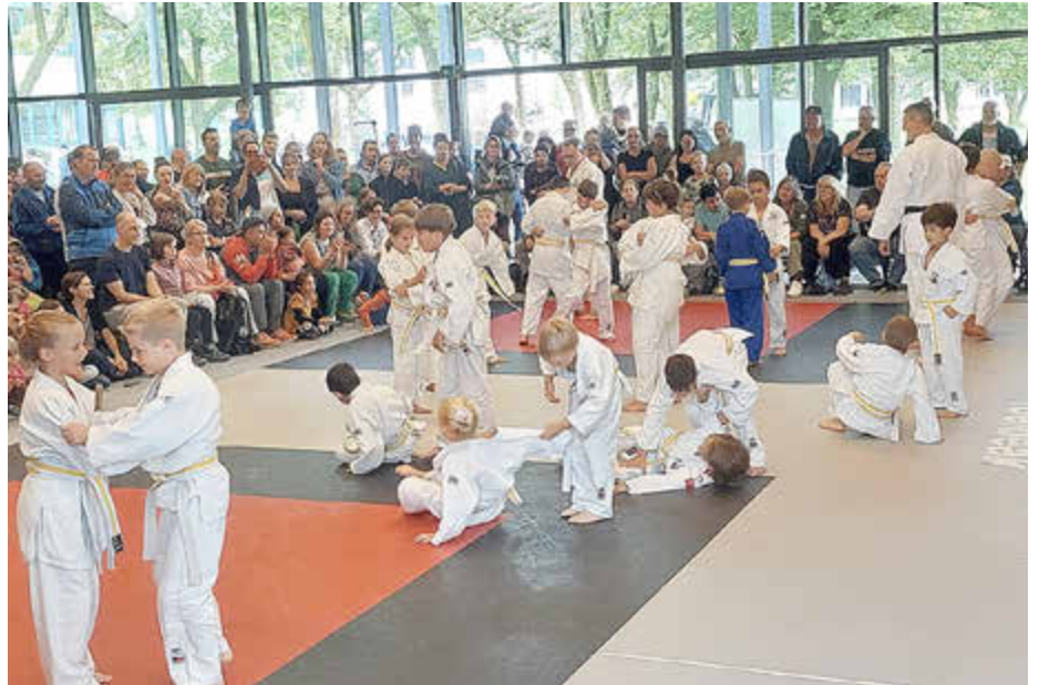
Prüflinge im Dojo