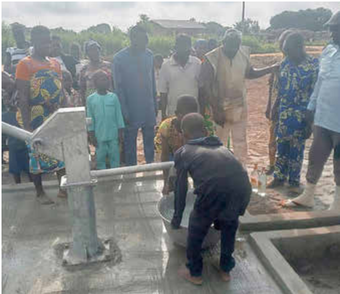
Das Bild zeigt beispielhaft die neue Brunnenanlage in OKE OWE.

Weitere drei Brunnenprojekte im August 2025 fertiggestellt