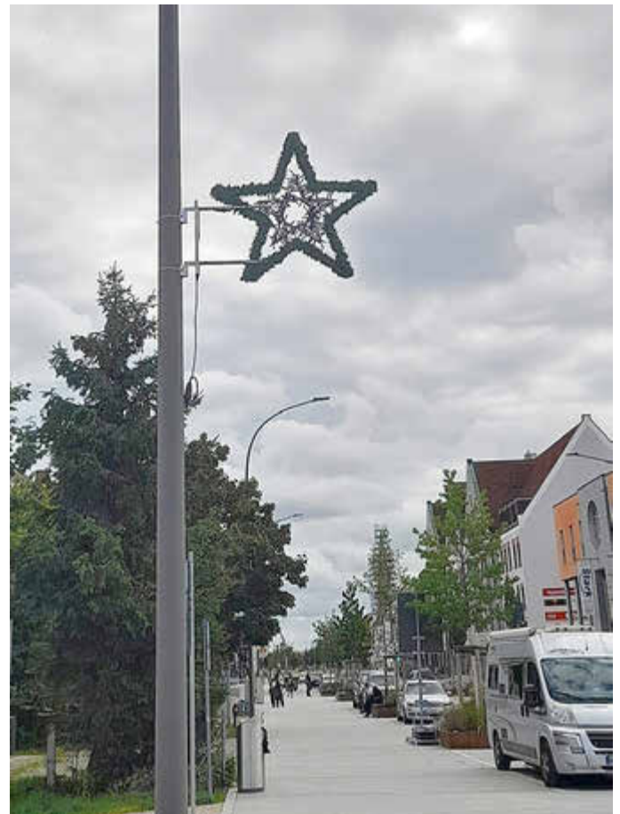
Falls Sie sich Anfang September über Weihnachtssterne an den Lichtmasten in der Bürgermeister-Wohlfarth-Straße gewundert haben: Es handelte sich um einen Test der Abteilungen Wirtschaftsförderung, Tiefbau und Betriebshof für die Weihnachtsdekoration im neugestalteten Zentrum – denn bis zur Adventszeit ist es gar nicht mehr lange hin ...