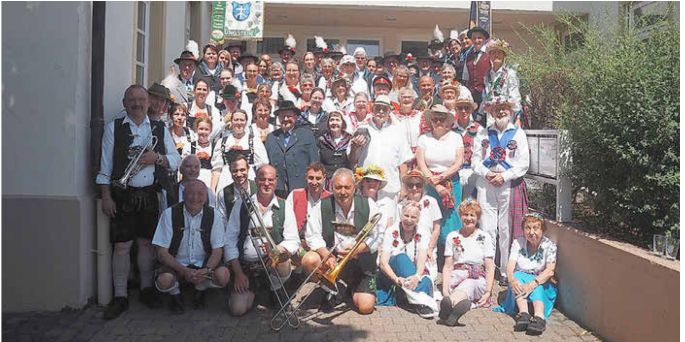
Gruppenbild der befreundeten Vereine

D'Lechauer Königsbrunn bei der Trachtengruppe Ungstein