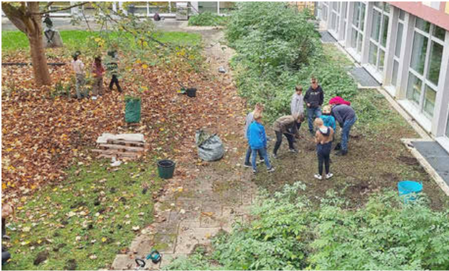
Innenhof für die Bienen vorbereiten

Schulprojekt begeistert junge Imkerinnen und Imker