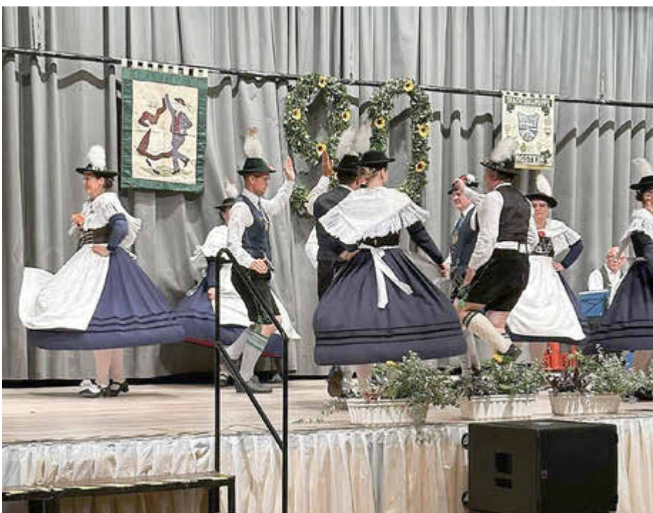
Auftritt D'Lechauer am Festabend

(Heimat- und Volkstrachtenverein „D'Lechauer“)