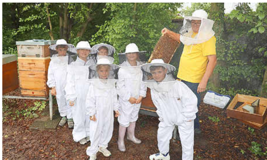
Bei den Bienenbeuten