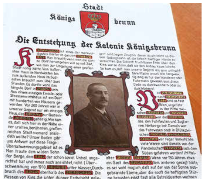
Jede einzelne Seite der Chronik ist aufwendig, detailreich und kunstvoll gestaltet.