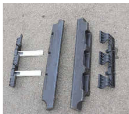
Insgesamt wurden 6.000 Schienenstegdämpfer entlang der Strecke verbaut.