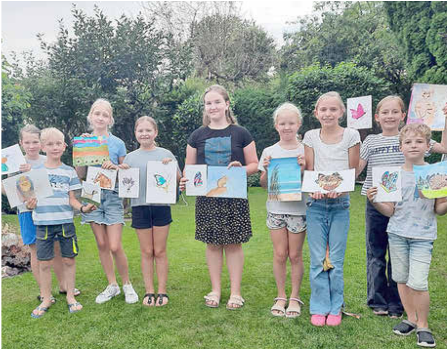
„Freude am Aquarellmalen“ beim Ferienprogramm am 27. August