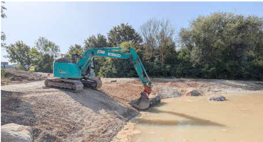
Umfangreiche Arbeiten und Planungen laufen derzeit zur Umgestaltung am Gymnasiumweiher.

Ufer, Wege und Naturbereiche nehmen Gestalt an