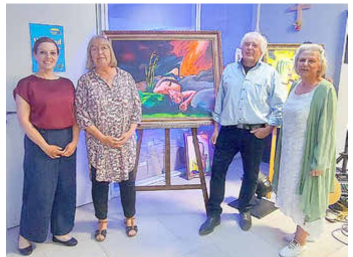
Vernissage der Ausstellung „Eschenlohe – Impression Mensch“ am 2. Mai