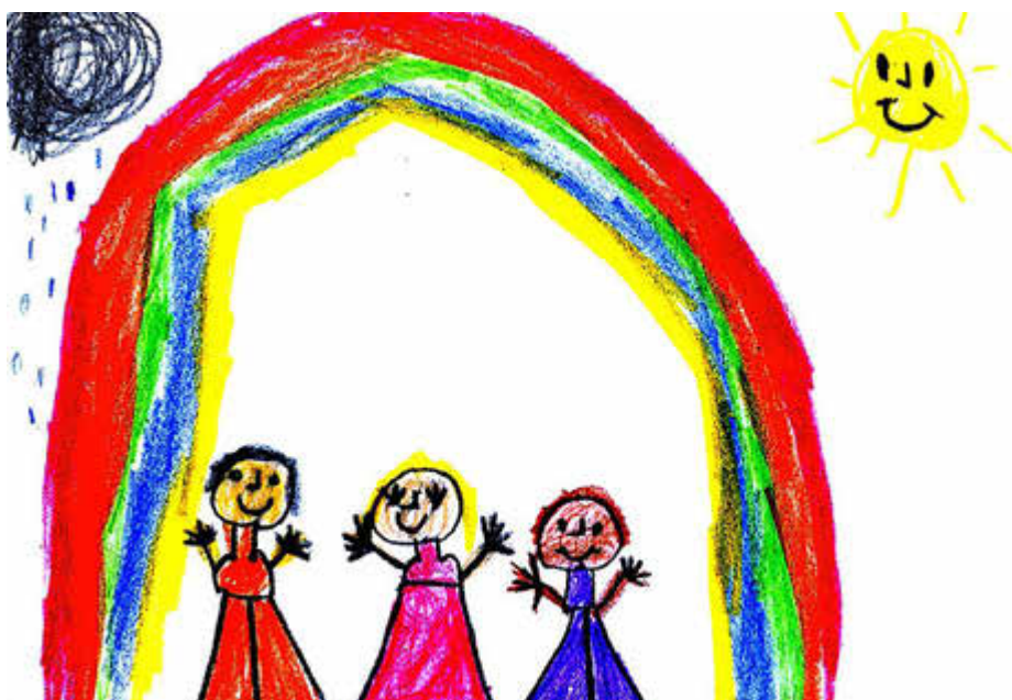
Fröhliche Kinder in Evang.-Luth. Kindertagesstätten

Im Johannes Kindergarten, Heimgartenstraße 4, findet kein „Tag der offenen Tür“ statt. Sie können jedoch gerne mit Frau Kreiser (Leiterin) einen individuellen Informationstermin vereinbaren (Tel. 08231 2541).