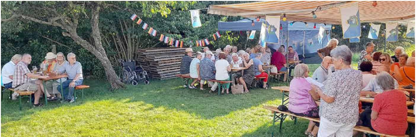
Die Teilnehmerinnen und Teilnehmer genossen die angenehme Atmosphäre beim Sommerfest des Rabforums.

Auch im Jahr 2026 wird es wieder eine Busreise zu unserer Partnerstadt Rab geben. Weitere Informationen dazu unter Tel. 08231 2999.