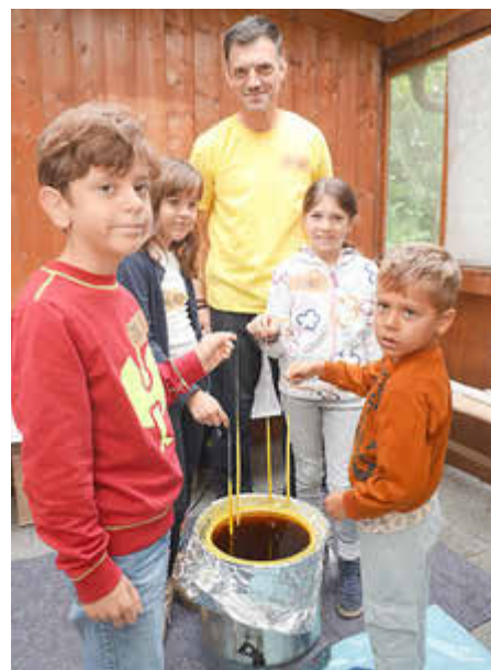
Flüssiges Wachs bei 71°C ergibt super Kerzen!

Strahlende Kinderaugen, neugierige Fragen und der Duft von Bienenwachs – so lässt sich der gelungene Ferientag beim Imkerverein Königsbrunn zusammenfassen. Die jungen Teilnehmerinnen und Teilnehmer erhielten einen spannenden Einblick in die Welt der Honigbienen und in den Alltag einer Imkerin bzw. eines Imkers.